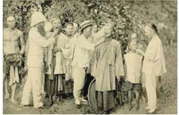
圖1. 民眾排隊等馬偕或學生拔牙。

馬偕的台灣回憶錄（傳記） 4 ，馬偕有一段描寫本地人對牙痛的觀念，馬偕說：「牙醫術是台灣醫療宣教中最重要的一環。牙痛是歷久以來，成千上萬的漢人和原住民的一種痛苦，牙痛可能因嚴重的瘧疾、嚼檳榔、吸煙或其他不良的習慣而引起。人們對於牙齒成長、牙病及牙齒的治療，懷有許多的迷信。他們相