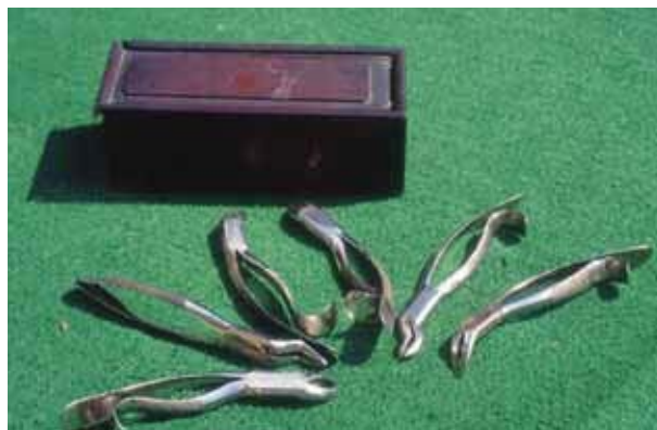
圖2. 馬偕博士的拔牙器具 馬偕博士贈與其得意門生陳榮輝牧師。後由陳牧師次子陳清忠校長的遺孀謝香女士捐贈給淡江中學

1873年第一次到1893年時（下節會再解釋），馬偕20年總共為台灣人拔了超過2萬1千顆牙。若扣除1880-81旅遊及在加拿大休假那年，約18年為台灣人拔牙，從上面及以後的討論，每年拔約1千多顆牙，對馬偕而言不難。他在傳記中還說，他的學生們，約拔了他的半數。